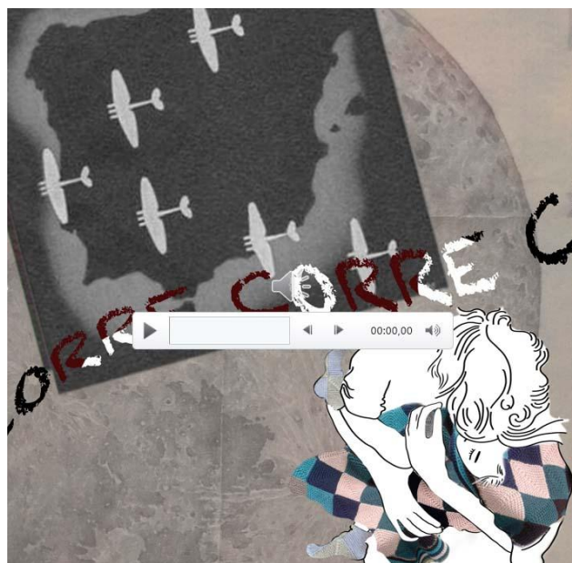
Figura 1. Audiovisual- Narración sobre el refugio de la Guerra Civil Española. Diaporama por María Angulo.

También la etapa de escolarización, en cuanto al tipo de institución y el objetivo de la misma, muestra un contraste profundo, atendiendo al género y la clase social; así, por ejemplo, las relatoras procedentes de familias dedicadas al sector primario explican que asistieron (R1) “a una escuela en donde te preparaban para servir”; (R7) “en el colegio me enseñaron a coser, todo lo que sé coser lo aprendí allí, las niñas era lo que hacíamos, leer, escribir un poco y coser”; aspecto que indica que la etapa de escolar, en las familias de extracción humilde, tenía como finalidad ganarse la vida en sectores feminizados. Sin embargo, (R9), al hablar de su escolarización explica que “transcurrió en dos internados para señoritas, en Londres primero y en París después (Figura 2 y Figura 3). Mi padre quería que aprendiésemos idiomas. Saber francés e inglés te permitía brillar en sociedad.”