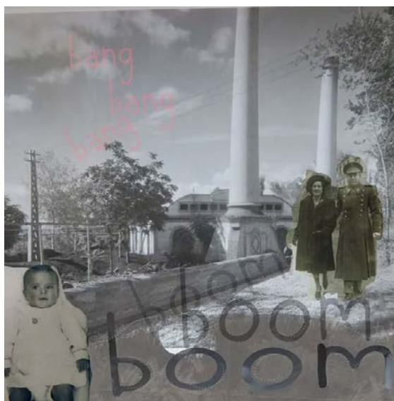
Figura 5. Encuentro. Diaporama por María Angulo.