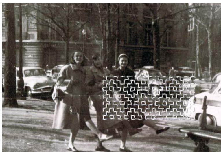
Figura 2. En París. Diaporama por María Alaejos López-Quesada. Fuente: María Alaejos.

la vida. En otras familias no les daban tanta importancia a los estudios. De mi calle y de mis amigas, yo fui la única que terminó la Universidad. Las demás se fueron a trabajar al terminar la educación primaria.” De modo similar, otra mujer explica como la prioridad de sus padres era que ella y su hermana trabajaran y lo hicieron toda la vida, (R8) “cuando terminamos el colegio nos apuntaron a una academia, donde nos daban cultura general, taquigrafía, mecanografía y contabilidad para poderlos colocar pronto, querían que fuésemos independientes.” En el lado opuesto, una relatora (R11) explica cómo los estudios y el trabajo quedaron siempre fuera de su alcance por decisión de su familia, “me hubiera gustado estudiar, quise haber sido enfermera, pero como no pude estudiar, pues nada, me dediqué a mis niños y a mi casa, que fue para lo que me educaron.”