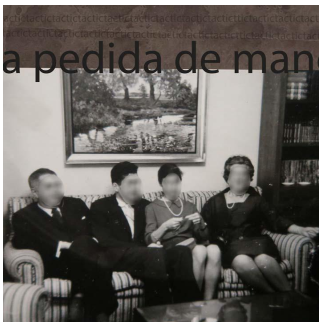
Figura 4. La pedida de mano. Diaporama por María Angulo. Fuente: María Angulo.

El amor aparece descrito del siguiente modo: “Pocos novios” relata una participante (R2), “ni había tiempo, ni estaba bien visto”, añade otra (R11), “a menudo, te casabas con el primero que aceptaban tus padres, antes era así”. Y (R2) “la verbena”, (R3) “el baile y (R10) “los hermanos varones”, son señalados como los lugares y las personas que facilitaban el encuentro con los enamorados. Para las mujeres, el matrimonio como proyecto de vida, era casi la única salida y es que la socialización de género era muy marcada y los roles productivos y reproductivos, como puede leerse a continuación, estaban perfectamente determinados (Figura 4). Así, una participante (R1) explica que “casarse era seguridad para el futuro, siendo mujer, no había otro camino”. De modo similar, pero ahondando en el sentido o concepto del deber, otra relatora (R2) cuenta: “me he casado dos veces, una por obligación, ya que me quedé en estado y me tuve que casar, y la segunda vez, ya de mayor, por amor.”