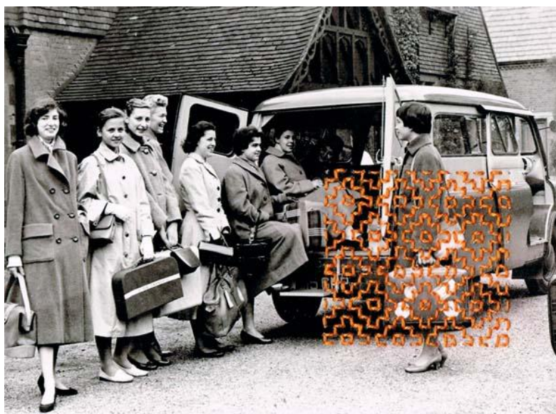
Figura 3. En Londres, recién llegadas al Colegio. Diaporama por María Alaejos López-Quesada.